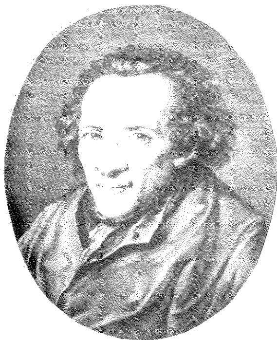
משה מנדלסון הוציא את "קהלת מוסר" במאה ה-18

בדסוי, עיר הולדתו של מנדלסון, הוציאו ב-1806 ירחון משכילי בגרמנית בשם "שולמית" (1806-1848, ואף זאת בהפסקות ניכרות). 4 ה"שולמית" נוצרה בתקופה שעמדה כולה תחת השפעתו של נפוליון וכיבושיו, ואף תחת השפעת הריאקציה נגד השתלטות הצרפתים על אירופה. כתב-העת חייב היה אפוא להתמודד עם הבעיות שניעורו מסביב מאורעות אלו באירופה כולה, וליהודים שבתוכה בפרט. לשם קיצור נסכם אותן תחת הכותרות "משבר האסימילציה", "משבר החינוך", "משבר האמונה" ו"משבר המסורת". אדם בן-ימינו היה משתמש בכתוך שגרה במונח: