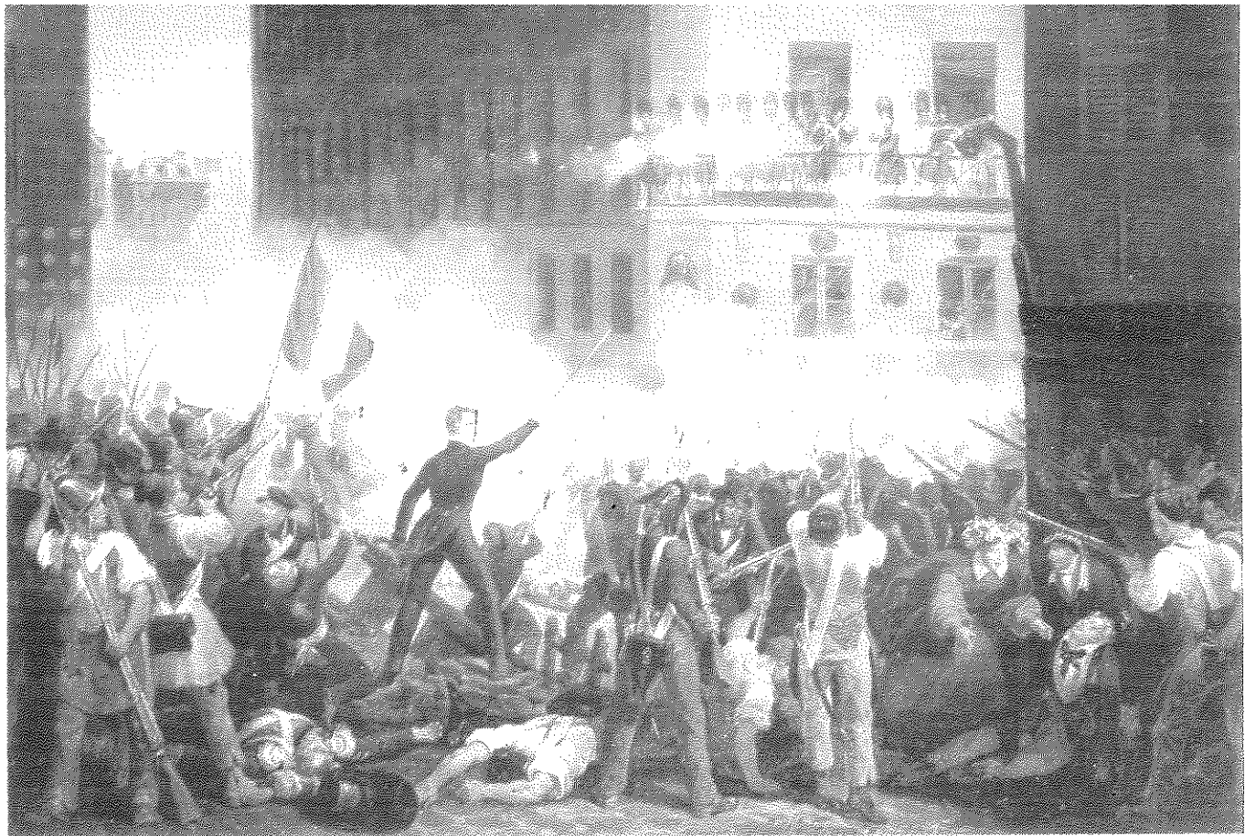
מהפכת 1848 (כאן בצרפת) השפיעה לרעה על התפתחות העתונות היהודית

ומדע ("Literaturblatt"). תחילה התרוצצו בגיליון-החדשות מגמות שונות ומנוגדות — ואף קולות פרוטוציוניים לא נעדרו ממנו. מאוחר יותר התגלעה סתירה מסוימת בין מגמות דתיות-שמרניות מתונות ובין מגמות כלל-מדיניות ליברליות שנטו — בהתקרב המהפכה של 1848 — יותר ויותר לרמוקרטיה רדיקלית. התוצאה מכך היתה שאחרי המהפכה נאלץ פירשט לסגור את גיליון-החדשות שלו, מחשש הריאקציה הממלכתית, והנסיך לקיים את גיליון-התרבות כפרסום עצמאי לא עלה יפה ואף הוא נסגר ב-1851.